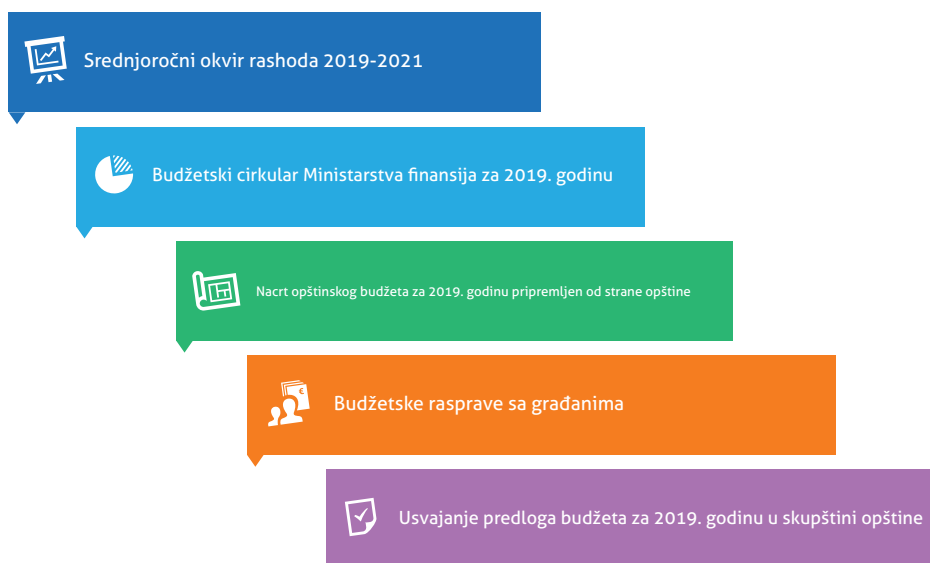
Dijagram 1: Postupci izrade opštinskog budžeta

Nakon što izvršna vlast opštine izradi nacrt budžeta na osnovu goreopisanih postupaka, ona građanima predstavlja isti na javnim budžetskim raspravama, na kojima se od njih očekuje da pruže svoj doprinos. Ovaj proces počinje maja aktuelne godine dostavljanjem prvog budžetskog cirkulara i nastavlja se do kraja septembra, kada odnosne skupštine usvajaju opštinske budžete. Proces se nakon toga nastavlja izvršenjem budžeta, dakle ubiranjem prihoda i njihovom potrošnjom u skladu sa planom i rebalansom budžeta nakon šest meseci, na predlog izvršne vlasti i po usvajanju pri skupštini opštine.