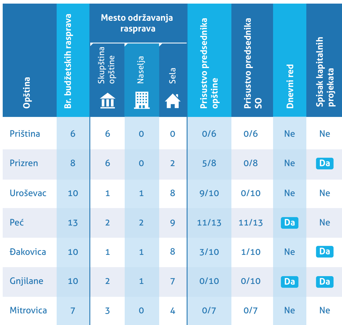
Tabela 1. Budžetske rasprave o budžetu za 2019. godinu