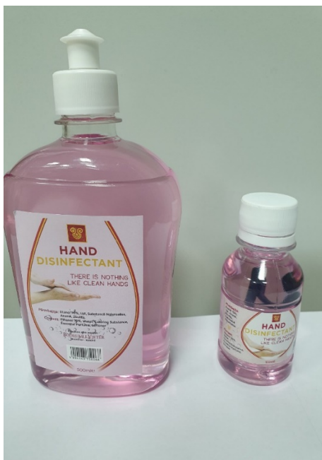
Figura 1: Mostra që ka dërguar Bodrumi i Vjetër

Megjithatë, për llot 1, çmim më të ulët ofertuan disa operatorë tjerë ekonomikë. Ndër ta ishin Happy Sh.P.K me 22,700.00 euro, Beni Dona po ashtu me 22,700.00 euro, Vlora & Office 1 Kosova me 29,900.00 euro dhe Day Star me 30,000.00 euro. Arsye e eliminimit të tyre kryesisht kishte të bënte me mostrën e produkteve e cila u kërkuar në dosje të tenderit. Day Star edhe është eliminuar pasi nuk ka sjellë mostrën në ditën e hapjes së ofertave. AK kishte kërkuar që dezinfektuesi prej 500ml të jetë i pajisur me bombolën me vrimë nxjerrëse, të cilën shihet se OE Day Star e plotëson sipas katalogut të dorëzuar. Mirëpo mostra e dërguar nga Bodrumi i Vjetër nuk e plotëson kërkesën e dosjes së tenderit pasi nuk dezinfektuesi 500ml nuk ka bombolë me vrimë nxjerrëse, por ka vetëm kapakun që mundëson daljen e lëngut për dezinfektim. Sigurisht që pajisjet që kanë bombolë nxjerrëse mund të kenë kosto më të lartë të prodhimit. Mosplotësimi i kërkesës i ka mundësuar OE që të ofertojë me çmim më të lirë.