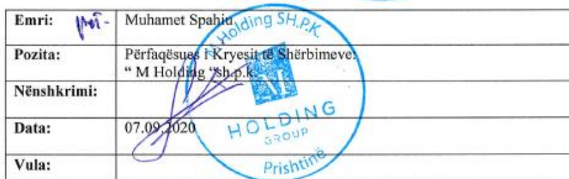
Figura 1: Mungesa e nënshkrimit të kryetarit të Komunës së Vushtrrisë në kontratën me M Holding

Sa i përket zbatimit të kontratës, studimi për të cilin është kontraktues M Holding ishte planifikuar të kryhej në tri faza: