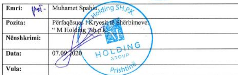
Grafikon 1: Nedostatak potpisa predsednika opštine Vučitrn u ugovoru sa M Holdingom

Što se tiče realizacije ugovora, studija za koju je M Holding bio izvođač radova planirana je da se obavi u tri faze: