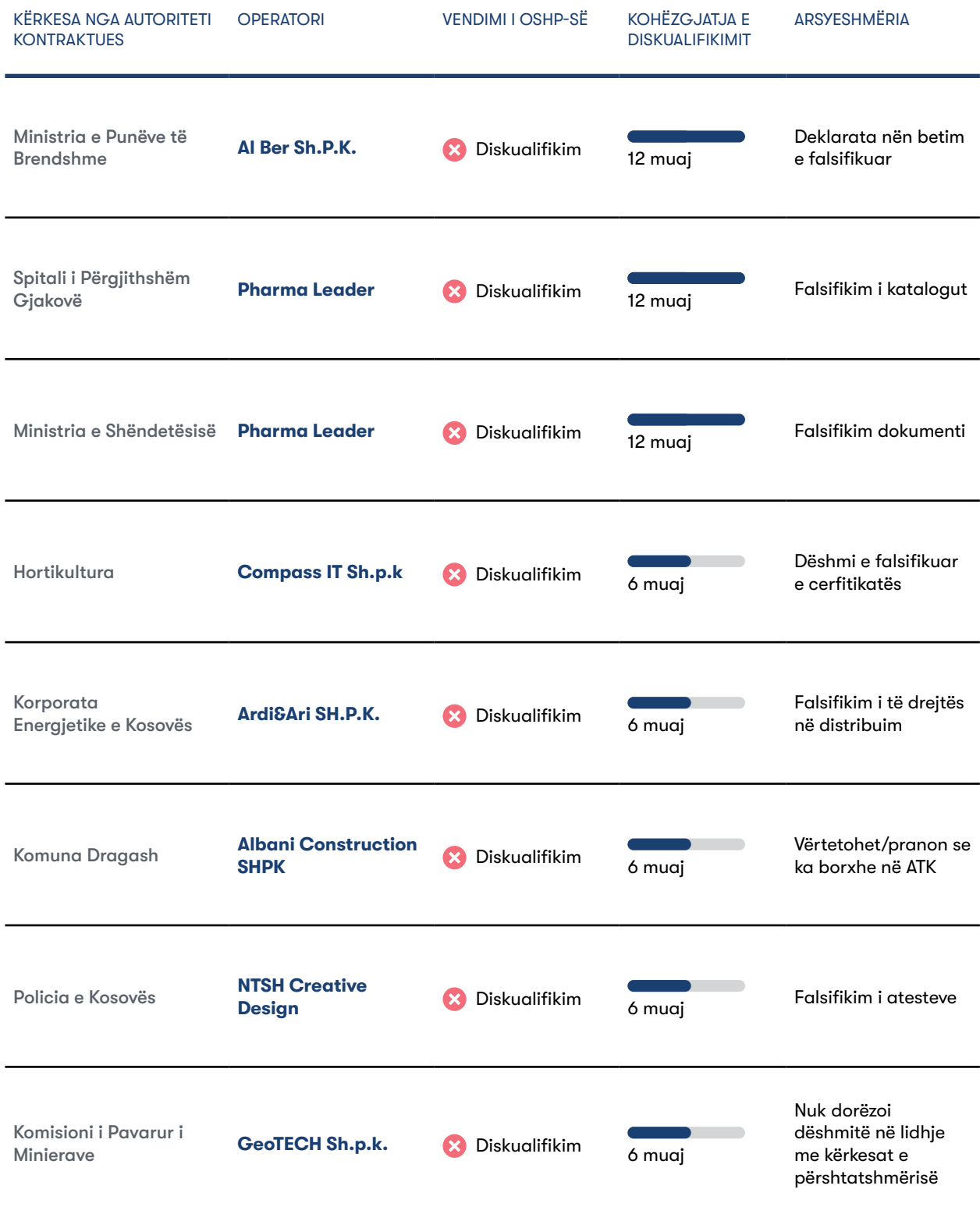
TABELA 1: Lista e operatorëve ekonomik që u futën në listën diskualifikuese (janar-qershor 2024)